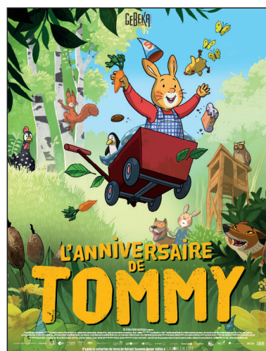
Affiche 120 x 160 cm Affiche 40 x 60 cm en vente chez Sonis