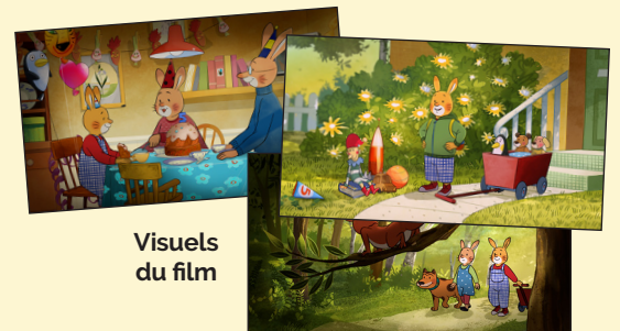
Visuels du film