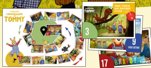
Le Jeu de l'oie (version grande nature ou plateau de jeu)

À COMMANDER OU À TÉLÉCHARGER sur www.gebekafilms.com