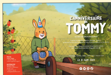
Dossier de presse